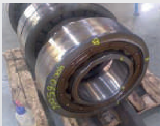
PEÇA 3 - Rolamentos de Rolos Cilíndricos