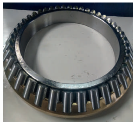
PEÇA 1 - Rolamentos Autocompensadores de Rolos Axiais