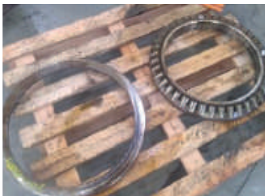
PEÇA 1 - Rolamentos Autocompensadores de Rolos Axiais