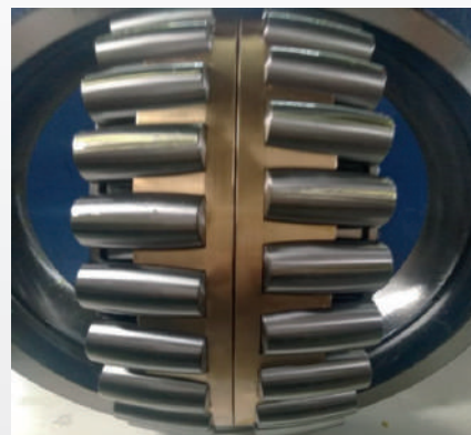
PEÇA 2 - Rolamentos Autocompensadores de Rolos Esféricos