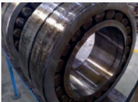
PEÇA 2 - Rolamentos Autocompensadores de Rolos Esféricos