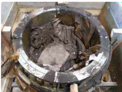
Condições de Recebimento