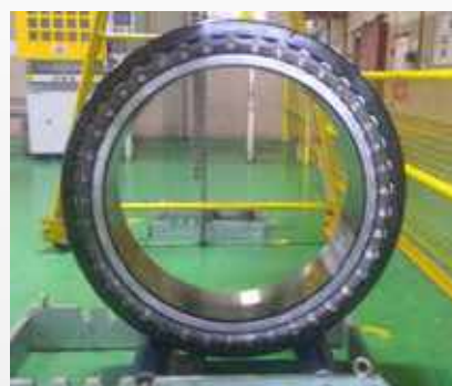
Procedimento de Limpeza