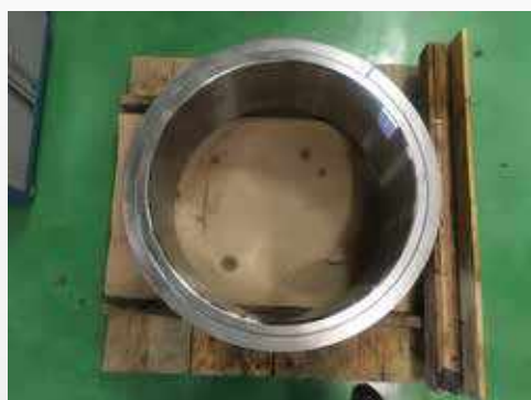
Procedimento de Limpeza