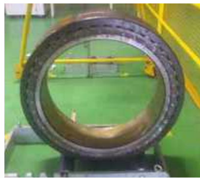
Condições de Recebimento